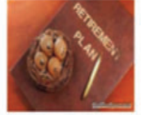
Đầu tư quỹ hưu trí

Hãy bảo vệ tương lai của bạn và gia đình bạn ngay hôm nay