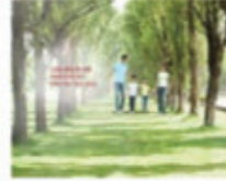
Bảo hiểm nhân thọ