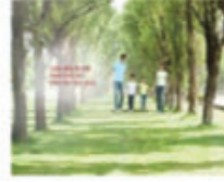
Bảo hiểm nhân thọ