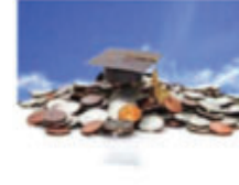
Đầu tư quỹ tiền học