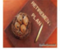
Đầu tư quỹ hưu trí

Hãy bảo vệ tương lai của bạn và gia đình bạn ngay hôm nay