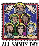
ALL SAINTS' DAY

Thánh lễ trọng mừng kính các thánh nam nữ sẽ được cử hành lúc 7 giờ tối ngày 1 tháng 11. Xin kính mời mọi người thu xếp thời giờ tham dự để mừng kính các thánh.