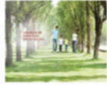
Bảo hiểm nhân thọ