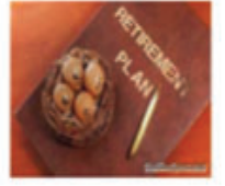
Đầu tư quỹ hưu trí

Hãy bảo vệ tương lai của bạn và gia đình bạn ngay hôm nay