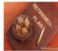
Đầu tư quỹ hưu trí

Hãy bảo vệ tương lai của bạn và gia đình bạn ngay hôm nay