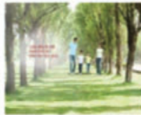
Bảo hiểm nhân thọ