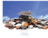
Đầu tư quỹ tiền học