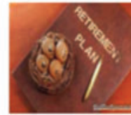
Đầu tư quỹ hưu trí

Hãy bảo vệ tương lai của bạn và gia đình bạn ngay hôm nay