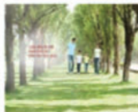
Bảo hiểm nhân thọ