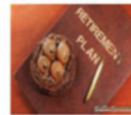
Đầu tư quỹ hưu trí

Hãy bảo vệ tương lai của bạn và gia đình bạn ngay hôm nay